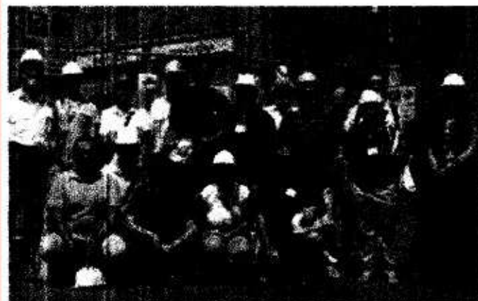
I volontari dell'Anab che hanno collaborato alle ricerche nella Bassa

I tecnici esperti di bioedilizia attivano un gruppo di acquisto per i materiali